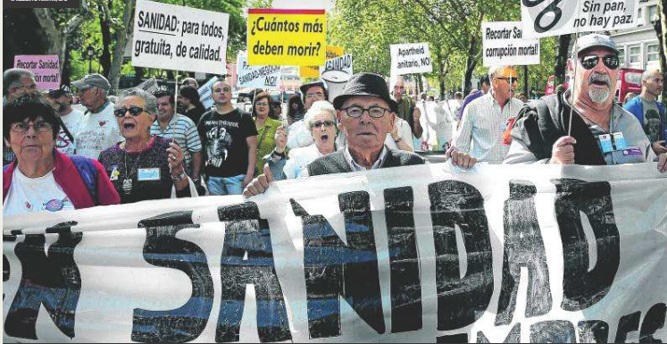
Polcar para vivir. Hace cinco años los pacientes con hepatitis C se lanzaron a la caza en demanda del revolucionario medicamento. El ALBERTO MARTINEZ

EN DETALLE 125.000 enfermos de hepatitis C han recibido el medicamento grato al tratamiento con Sovaldi. Los expertos estiman que entre 50.000 y 70.000 personas portan el virus sin saberlo. Los